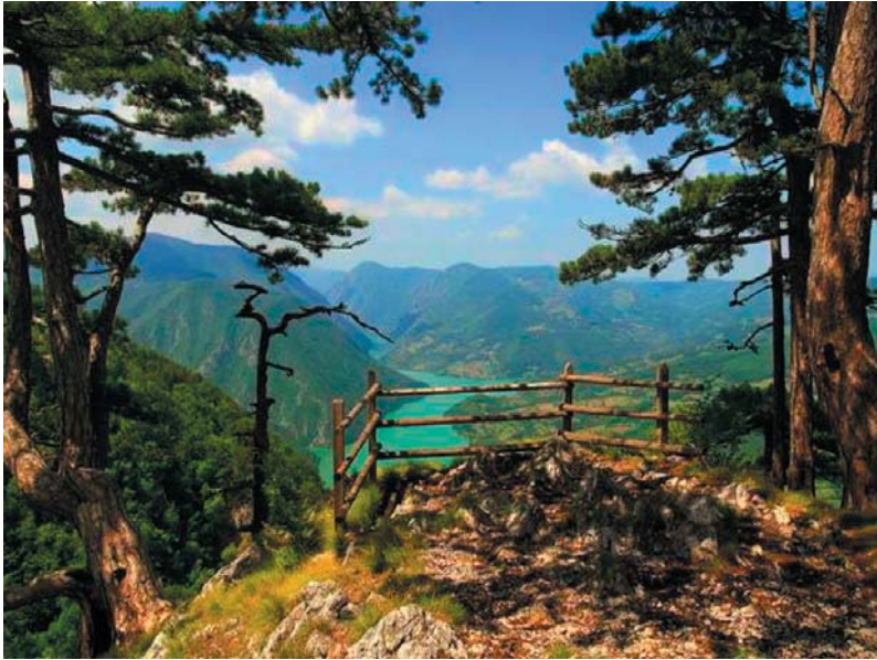
Слика 2. Овај поглед је нарочито волео (Тара – Бањска стена)