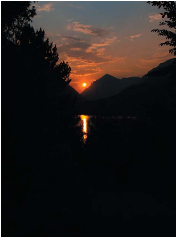
Слика 3. Изласке и заласке сунца посебно је осматрао