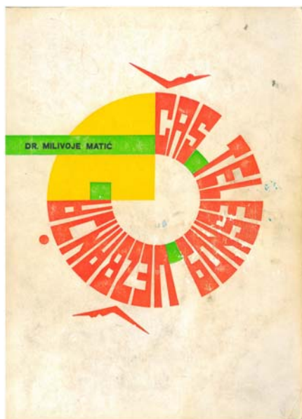
Сл. 3. Књига Час телесног вежбања

Корени и вредност књиге имали су дубоку позадину. Књига се одавно не може наћи. Примерци факултетске библиотеке су похабани што говори о њиховој употреби од корисника. Већина књига је меканог повеза. Но, аутор је од издавача захтевао да један број књига буде у тврдом брошираном повезу чему је и удовољено. Као да је предпостављао шта се са књигом у будућности може десити.