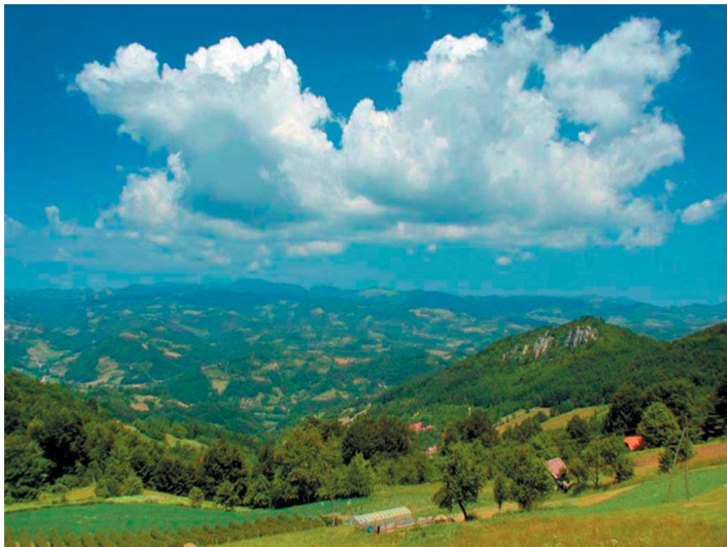
Слика 1. Давос је, додуше далеко, али ДОЋИТЕ НА ДИВЧИБАРЕ