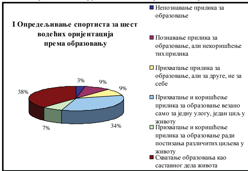
Графикон 2 Опредељивање рукометаша за образовне потребе

На Графикону 2, су приказани подаци које се не могу тако „очигледно видети“ из Табеле 1, а које се, такође, сматрају битним „помена“ у овом контексту разматрања односа унутар истраживаних проблема код активних рукометаша.